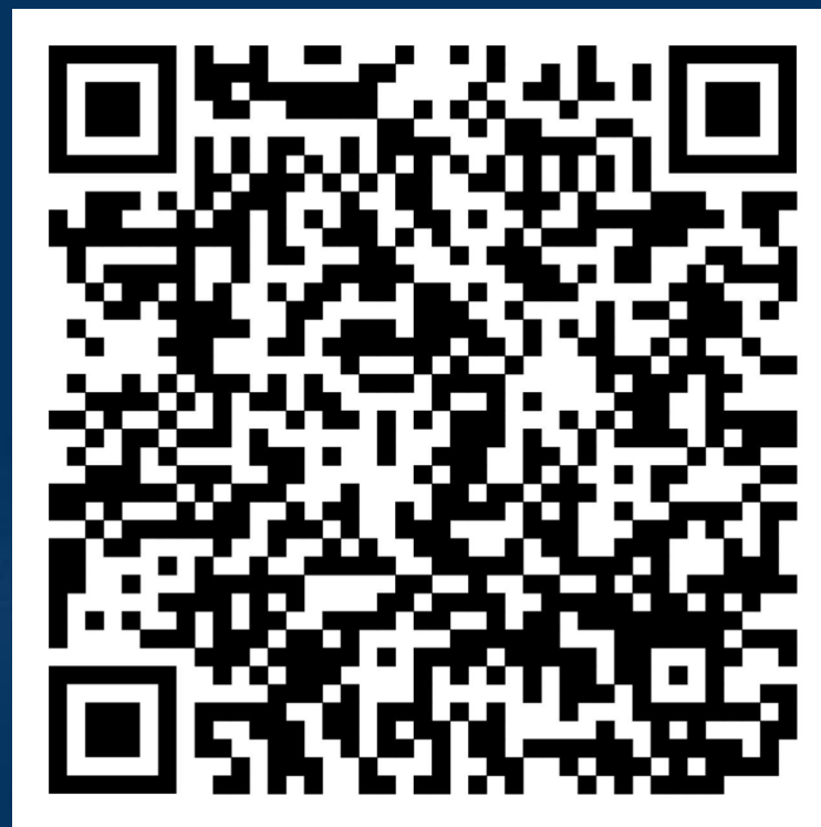
Заявка на участие в Конкурсе