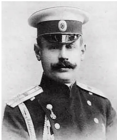
Владимир Николаевич Воейков

Русский военачальник, генерал-майор. Деятель российского спортивного движения - почётный председатель первого Российского олимпийского комитета.