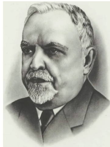
Николай Александрович Семашко

Русский военачальник, генерал-майор. Деятель российского спортивного движения - почётный председатель первого Российского олимпийского комитета.